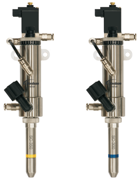
SC-350 Select Spray

EasyCoat® 6软件执行例行程序和验证步骤用以确定整个生产过程中涂覆喷头的最佳起止位置。