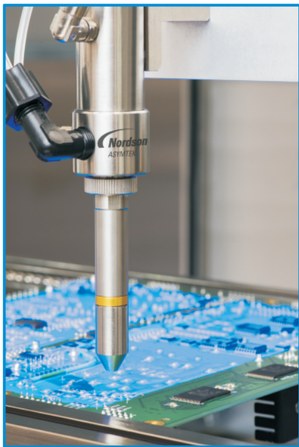
SC-350 Select Spray

SC-350采用较小的空气压力来实现更严格的边缘公差，从而在靠近禁止区域的位置提供更高的选择性和控制性，并减少溶基型胶体形成的“蛛网效应”。降低的空气辅助压力为您的工艺参数提供了更大的灵活性-以更快的涂覆速度获得更薄的涂层效果，适用于各种流体粘度。